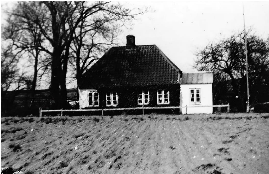
Vestermarken 7 i Felsted Mose 1941

I følge kontraktens §2 er han forpligtet " til at yde til Stamgården 4 fæstedage, nemlig 2 mand- og 2 fruedage når som dagen forud er tilsagt ".