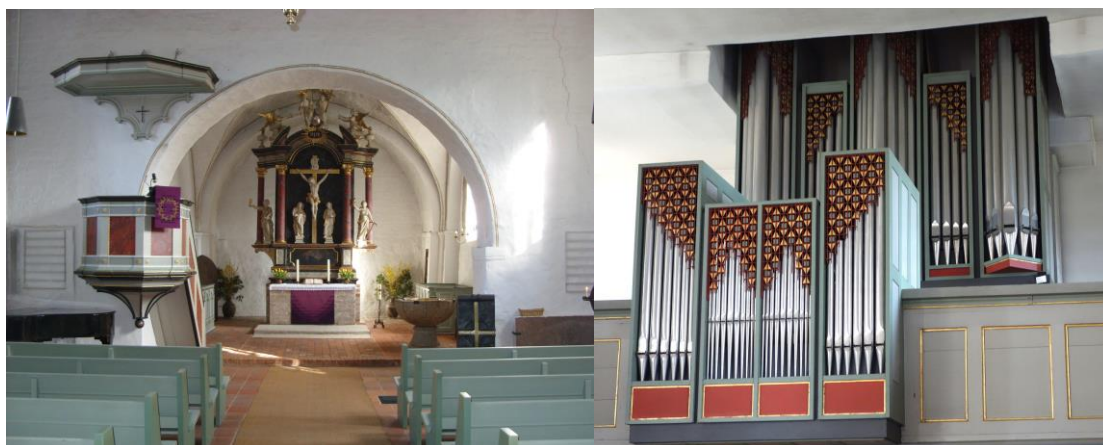
Sankt Georgsberg Kirke ved Ratzeburg