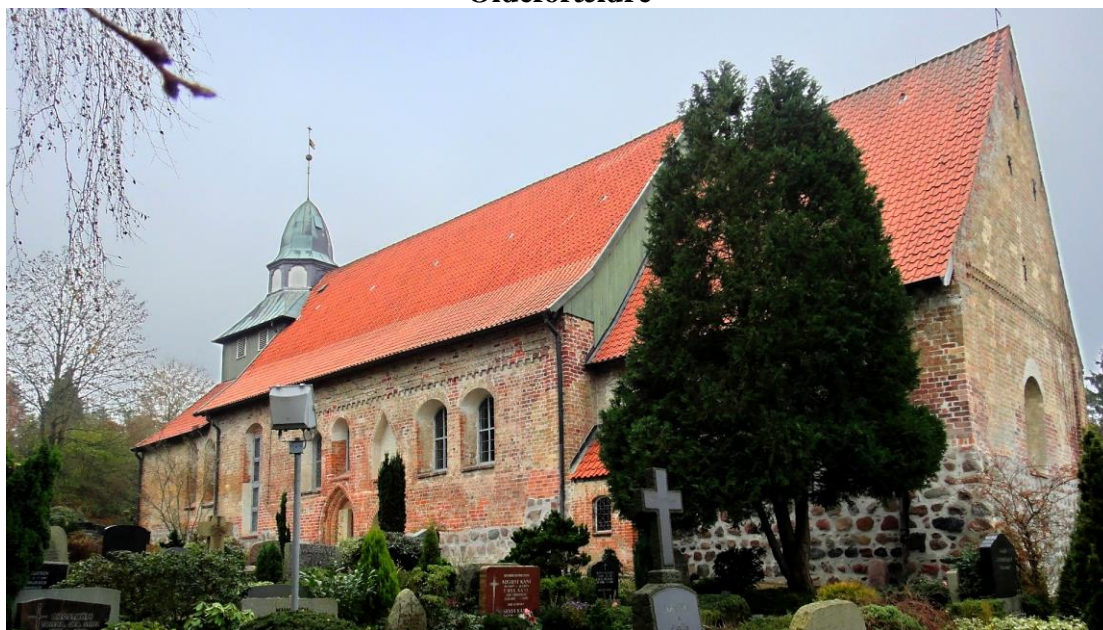
Sankt Georgsberg Kirke ved Ratzeburg