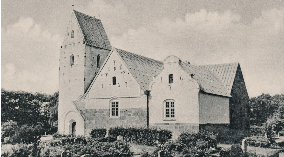
Ulfborg Kirke omkring 1940