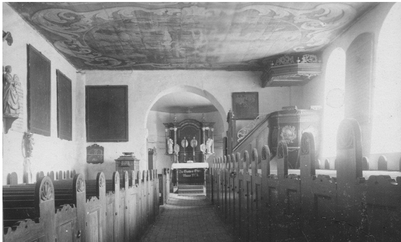
Ubjerg kirke omkring 1910